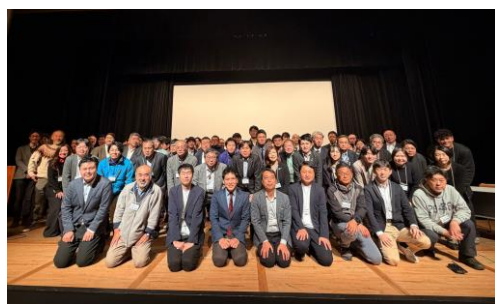
【NPNAキックオフワークショップ開催】

那須塩原市は、産業技術総合研究所、国立環境研究所と共同で、様々な主体と連携する枠組みである「ネイチャーポジティブ那須野が原アライアンス（NPNA）」を設立しました。シンポジウム・ワークショップの開催をはじめ、那須野が原地域の地下水の変化や生態系に関する勉強会を実施し、参加者間の情報共有と理解促進を図っています。